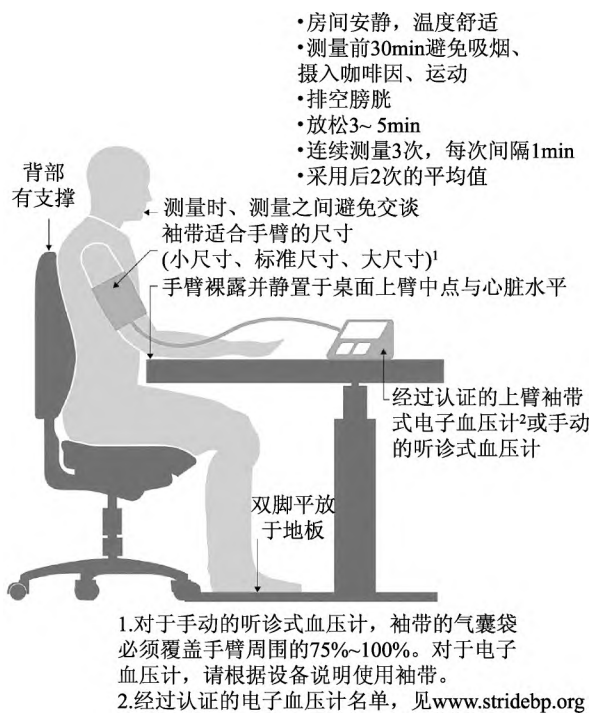
图1 《国际高血压协会 2020 高血压实践指南》血压测量要求

5.12.2 血压测量: 老年高血压的患病率达 49% , 远远高于中青年人群; 高龄老年人高血压的患病率更是超过了 90%。血压测量是评估血压水平、诊断高血压以及监测降压治疗效果的根本手段和方法。《国际高血压协会 2020 高血压实践指南》对血压测量的要求如下图 [81] :