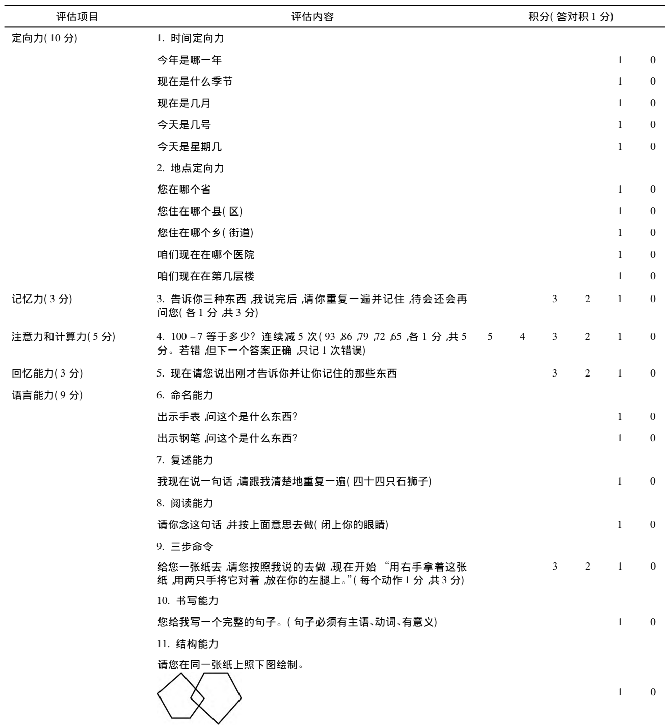
表 4 简易智力状态检查量表(MMSE)

5.10 健康自评 健康自评即询问受试者主观上对自身健康程度的评价情况,自我评价是基于人们对自身身体、心理状态